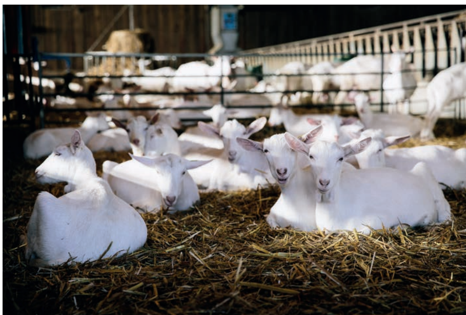
La gestion de la litière est prépondérante dans la maîtrise des STEC en élevage.